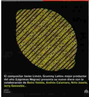
El compositor Javier Limón, Grammy Latino mejor productor del año ( Lágrimas Negras ) presenta su nuevo disco con la colaboración de Bebo Valdés, Andrés Calamaro, Niño Josele, Jerry González...

TE INTERESA... Sacar ya tu entrada para los conciertos con más romanticismo del verano: el Festival de Música Isaac Albéniz . Se celebra en Caprodon (Girona), hasta el día 25 de agosto ( www.ajcamprodon.com ).