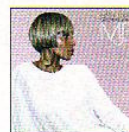
Mary J. Blige

"Se echa de menos la emoción. Ahora suena más madura, pero también más plana, sosa y previsible".