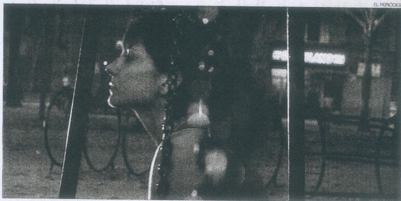
La actriz Marian Álvarez, en un fotograma de la película.

Oferta: sorteo de 20 ejemplares del libro De tot cor . Forma de participación: SMS al 5657 con el texto TR3SC (espacio) COR (espacio) NUMERO DE SOCIO. Al instante sabrán si han ganado. Precio SMS: 1,20 €+IVA. Recogida: mañana martes, a partir de las 10 h, en La Botiga (Bailèu, 86), con el carnet del TR3SC.