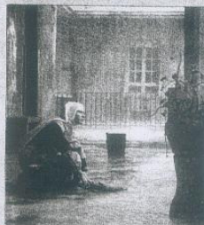
Fotograma de Malos hábitos .